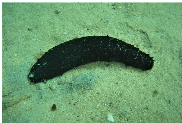
Εικ. 1: Holothuria poli

Περισσότερες πληροφορίες, στην επίσημη ιστοσελίδα του Έργου https://pharos4mpas.interreg-med.eu