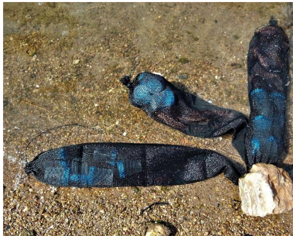
Εικ. 3: Σάκοι για τη μεταφορά των ολοθουρίων και των δοχείων συλλογής ιζήματος